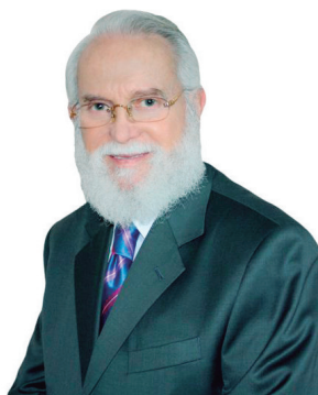
Reverendo William Soto Santiago Conferencista Internacional

Para mim, é um grande privilégio estar com vocês para termos uma curta conversa em torno da Palavra Divina e dar-lhes a conhecer o mistério do Monte da Transfiguração. Estaremos falando sobre o tema: "O MONTE DA TRANSFIGURAÇÃO ATUALIZADO", lugar onde Jesus Cristo subiu e Se transfigurou, e o Seu rosto resplandeceu como o sol. Leiamos esta formosa história bíblica da vida de Jesus, nesta etapa tão importante da vida de Jesus, onde Ele foi adotado.