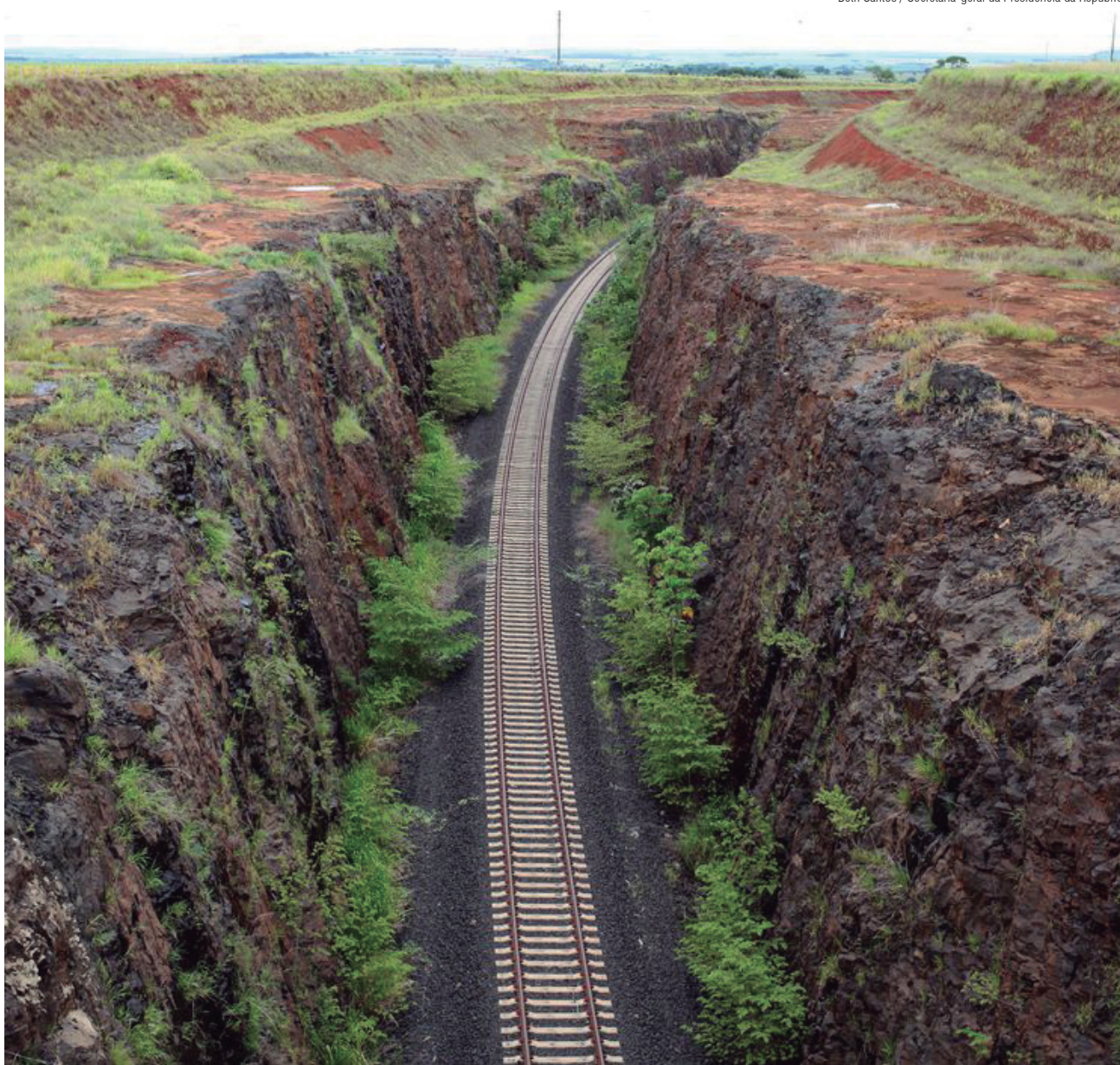
Segundo o plano do governo federal, a participação das ferrovias no total de transportes no Brasil deve chegar a mais de 30% em até oito anos

Além das novas concessões e autorizações, o ministro citou também, dentro das estratégias, a renovação antecipada de contratos. Ele projetou que os investimentos mobilizados com essas medidas podem ficar entre R$ 40 bilhões e R$ 100 bilhões.