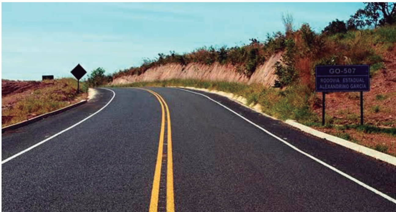
De acordo com o governo de Goiás, radares se revelaram ineficazes para conter acidentes no comparativo do primeiro semestre de 2018 e 2019

O fim da indústria de multas tem relação com a modalidade de governo adotada. De acordo com o gover-