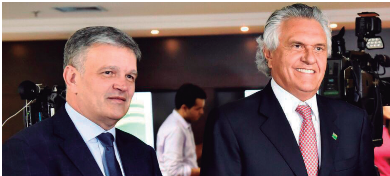
Governador Ronaldo Caiado e os gestores dos órgãos estaduais depositam confiança e credibilidade na atuação da instituição, que tem garantido a transparência dos atos e a probidade na aplicação dos recursos públicos no Estado

A busca pela efetividade em sua atuação só é possível em função do trabalho competente e rápido da equipe de servi-