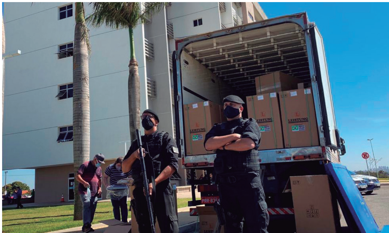
"Devido aos roubos, as empresas não vendem mais respiradores sem escolta policial. Nos sentimos muito honrados pela confiança", disse o comandante da GCM

recida, os 40 novos ventiladores mecânicos foram comprados pela prefeitura, por meio de pregão eletrônico, ao custo de R$ 60 mil cada. O edital do processo licitatório foi publicado no dia 26 de junho e 16 dias após a abertura, os equipamentos foram entregues. De acordo com o secretário, a expectativa é de que, ao manter as taxas de ocupação de leitos de UTI estáveis, como vem ocorrendo nos últimos dias, a cidade retorne ao cenário amarelo da Matriz de Risco do Ministério da Saúde, reduzindo assim o escalonamento social intermitente.