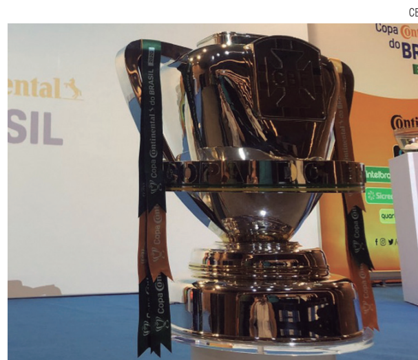
Início das Copas Libertadores e Sul-Americana segue indefinido

Essa temporada marca a estreia do novo sistema de disputa da competição, aprovado por todos os 20 clubes participantes do Conselho Técnico em março deste ano. Por fim, a Série D começa em 6 de setembro de 2020