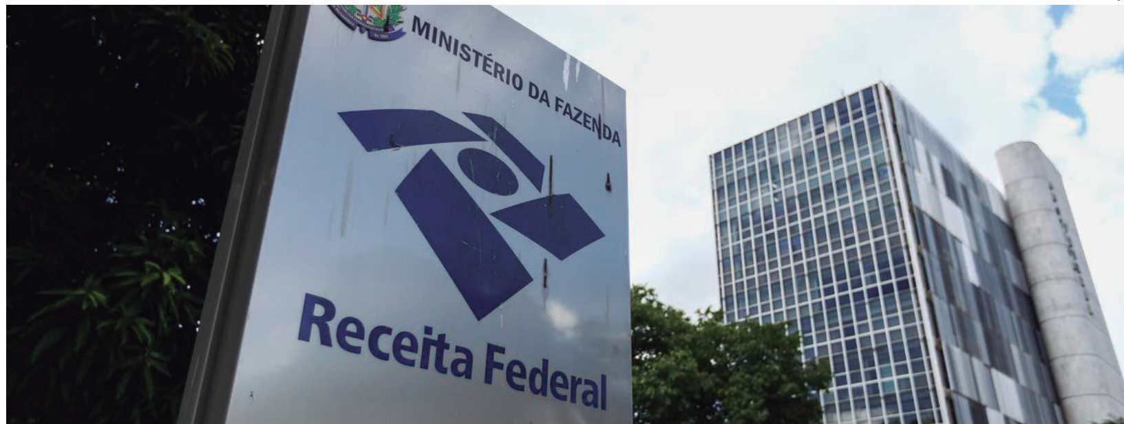
Contribuição da empresa para o INSS, assim como da agroindústria e dos empregadores rurais para a Previdência Social, deve ser quitada ainda este mês

buições para o INSS, a Cofins e o PIS/Pasep, a suspensão só valeu para as quotas de abril e de maio, cujo pagamento foi transferido para agosto e outubro, respectivamente. As quotas de junho, com vencimento em julho, devem ser quitadas.