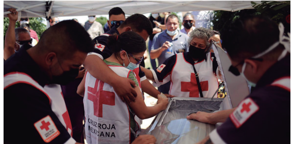
Análise do Cris-Fiocruz apontou que o surto nas Américas pode permanecer com picos pelos próximos dois anos

“Cada país tem mais de uma única epidemia em curso. O Brasil mesmo tem centenas de epidemias, cada uma com seu curso próprio, algumas onde já está esgotando, outras ainda acelerando. O mesmo panorama acontece na América Latina nos diferentes países. Mas em países muito pequenos, na América Central, no Uruguai, o número global do país é um bom