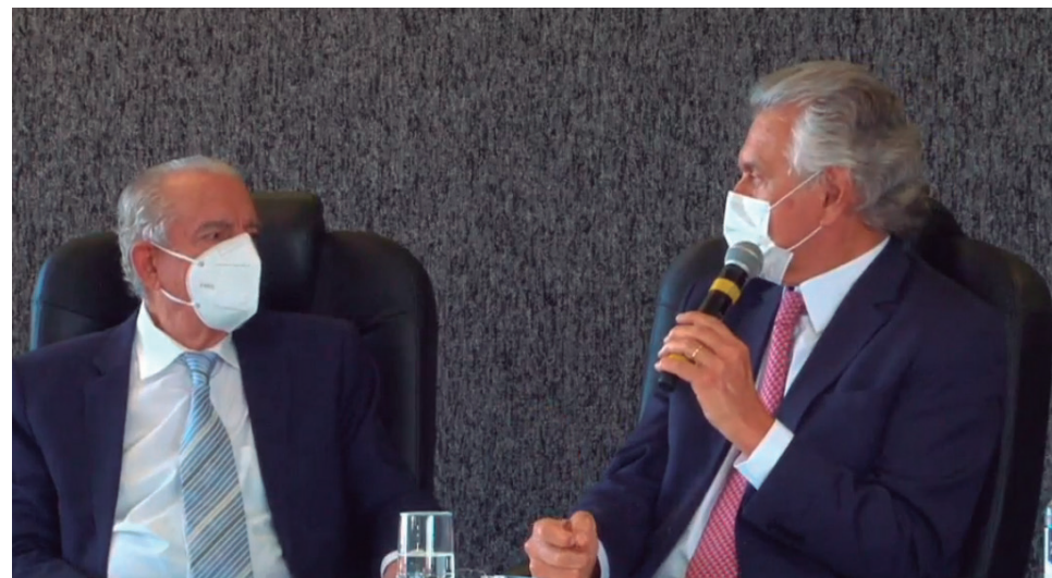
Ronaldo Caiado comentou que o prefeito da Capital conseguiu a participação da população, além do aval para tomar decisões assertivas no combate à Covid-19 em Goiânia

Em suas palavras, ele destacou que fez questão de estar com o emedebista por reconhecimento de cooperação. “O gesto humanitário do prefeito nestes dias complexos foi de aprendizado para mim. Digo meu muito obrigado”, agradeceu. Caiado proferiu que a saúde e a medicina não podem dar espaço para o palanque, pois é necessário fundamento científico e nunca o achismo. Ratificou em seguida que está lançando o desafio da segunda etapa, após os 14 dias de fechamento do comércio, e sugeriu que “se unirmos não teremos colapso na rede e não será preciso paralisar as atividades comerciais”.