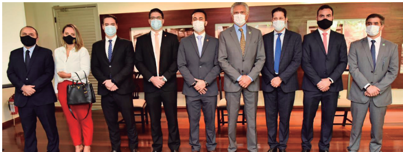
“Este é um compromisso do Governo: a sociedade goiana tem que viver com tranquilidade”, assegurou Caiado

Houve redução em todas as modalidades de roubo, sendo a mais expressiva a de veículos (38,29%), seguido de roubo de carga (34,95%), a pedestres (29,13%) e a residências (19,58%). Outro dado de destaque: durante os seis primeiros meses de 2020, não houve nenhum registro de roubo a instituição financeira em Goiás. Os registros de