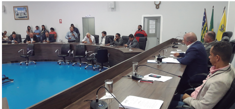
Na relação de agentes públicos municipais constam nomes de políticos em cumprimento de mandatos e com pré-candidaturas à reeleição anunciadas no município de Aparecida

O ex-presidente seguiu elucidando que, para estas viagens, eram concedidas diárias para os parlamentares. “Os vereadores