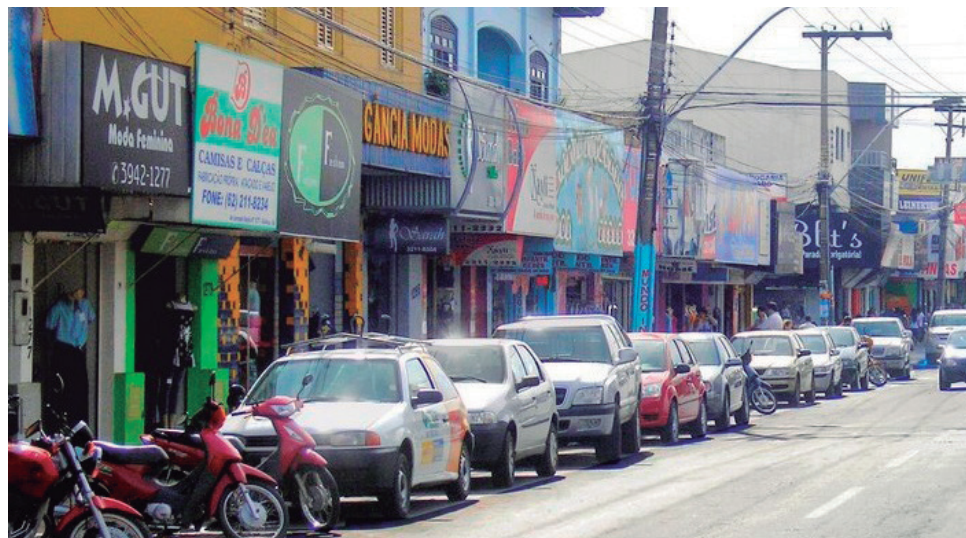
Entre as medidas estão o controle da entrada de clientes e a obrigatoriedade do uso de máscara

Nos salões de beleza e atividades relacionadas, deve-se usar jaleco ou avental por parte do trabalhador devido ao contato próximo com os clientes, bem como luvas, que deverão ser trocadas a cada cliente, e atender apenas com hora marcada, para evitar a aglomeração de pesso-