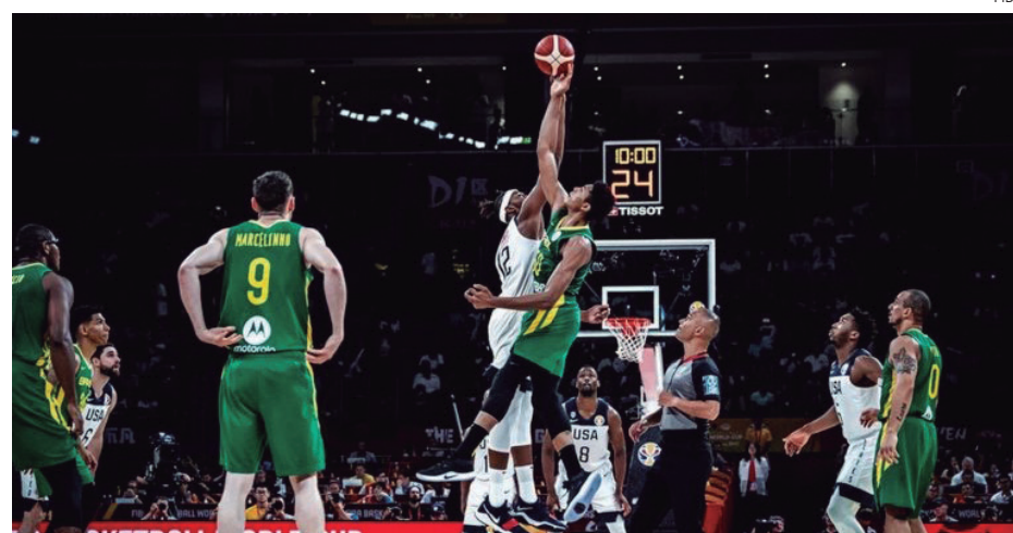
Delegação brasileira tentará vaga nas Olimpíadas de Tóquio, em abril de 2021

O reinício das competições da Fiba será baseado no novo calendário aprovado pela entidade em abril. A mais importante delas para o Brasil será o Pré-Olímpico de Basquete masculino. O torneio