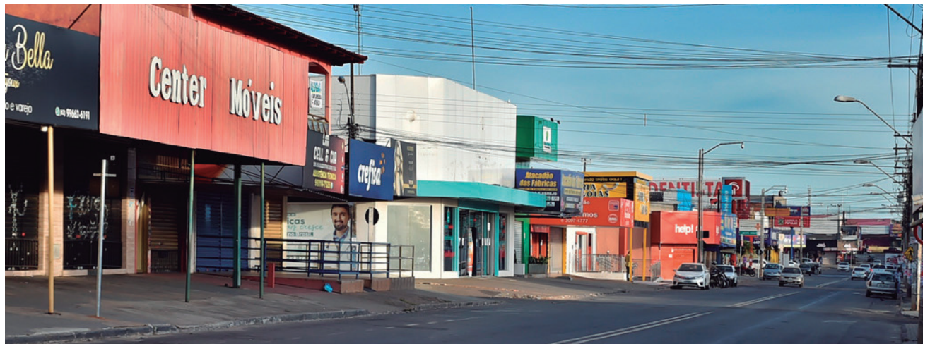
Comércios de cada macrozona passam a fechar somente uma vez de segunda a sexta-feira e todas as macrozonas fecham aos domingos

O gestor abordou ainda a redução do número de casos ativos na cidade, que entrou em declínio desde o último dia 1º, diminuindo assim o coeficiente de prevalência da doença. "Chegamos a ter mais de 1,4 mil casos ativos. Iniciamos o mês com 1.121. De lá para cá, esse número caiu paulatinamente e hoje está em 759. Isso demonstra