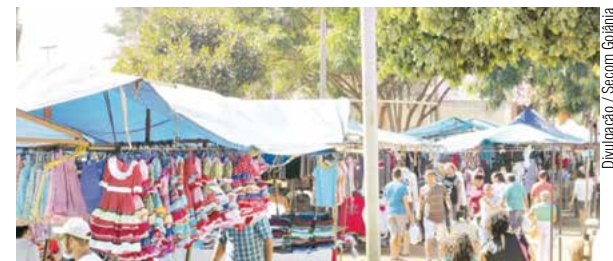
Feira deve funcionar das 7h de sexta-feira às 20h de sábado e a desmontagem ser iniciada logo após as 20h de sábado, tendo de ser finalizada até as 5h de domingo