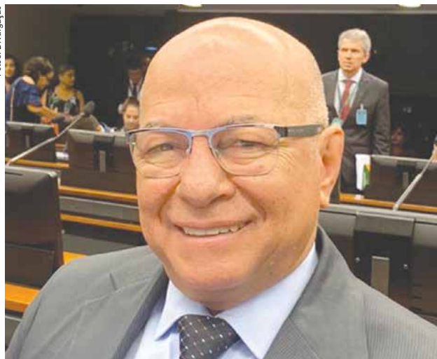
Professor Alcides (PP)

A lista de pretensos candidatos com base em Aparecida tem potencial para chegar a cinco postulantes para a Câmara Federal e 20 para a Assembleia Legislativa. Confira os nomes que já estão colocados para disputar as eleições proporcionais de 2022.