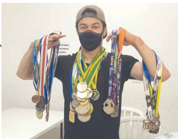
Entre as medalhas furtadas estavam três comendas conquistadas no Pan-Americano de Lima, em 2019