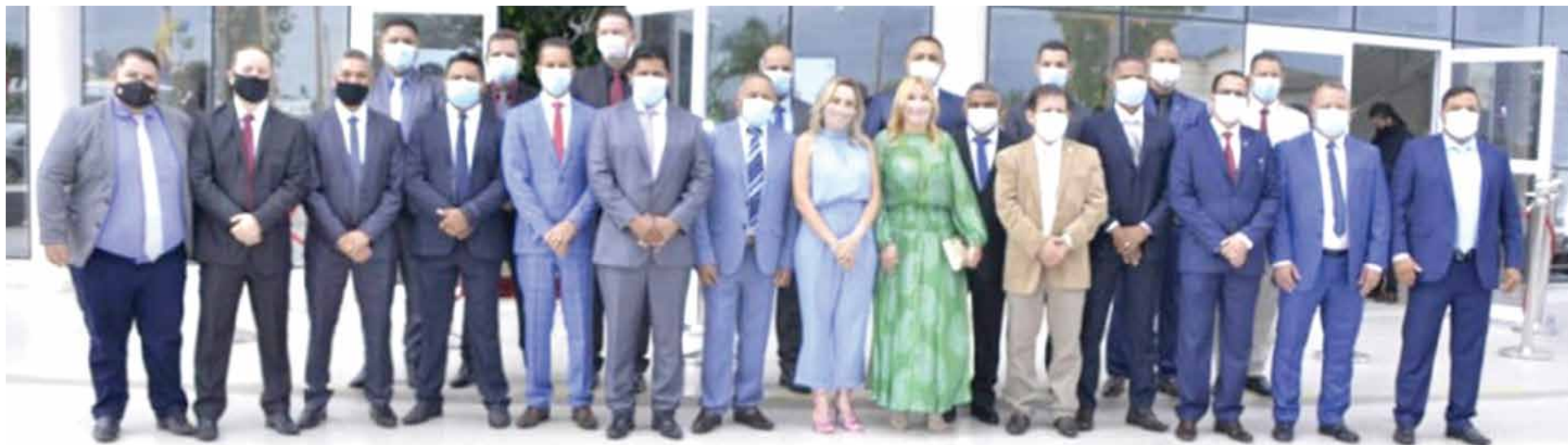
Os vereadores da atual Legislatura e as duas únicas mulheres entre eles: falta da presença feminina é a mesma no Executivo e no Legislativo

Representantes do sexo feminino são praticamente inexistentes na estrutura de governo do município, dominado pelo poder masculino